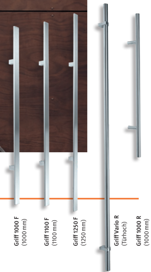
Griff 1000 F (1000 mm) Griff 1100 F (1100 mm) Griff 1250 F (1250 mm) GriffVario R (Türhoch) Griff 1000 R (1000 mm)

Fünf Griffe stehen Ihnen ohne Mehrpreis zur Auswahl